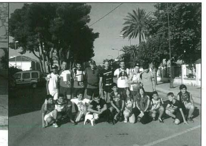
Sortida al Castell i voltants. 30 de maig de 2015. Amb el suport de l'entitat SUDACTIU d'Ulldesona