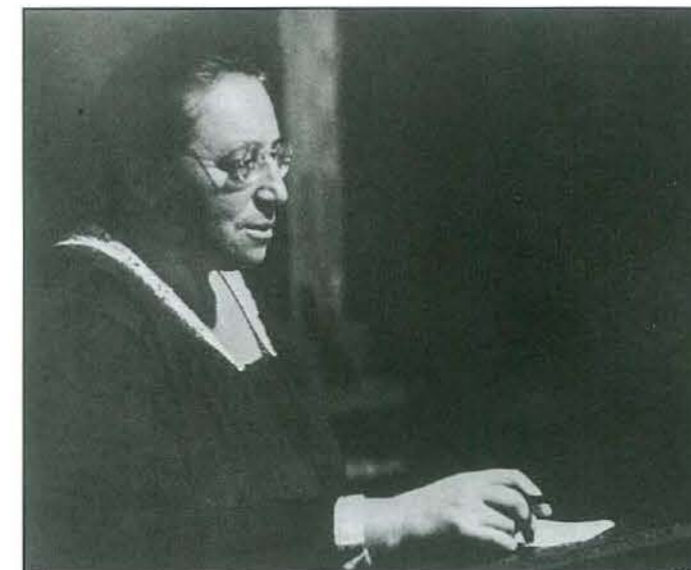
Fig: Emmy Noether

Pensilvània. El seu temps als Estats Units fou plaent, envoltada com ho estava de col·legues que la recolzaven, i absorbida amb els seus temes preferits.