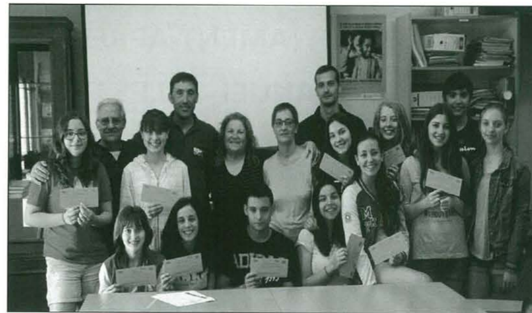
Dinamitzadors i dinamitzadors ajudants de monitors d'esports de les Escoles Esportives

Des de la més absoluta modèstia, per tot el relatat anteriorment, podem afirmar que en el foment de l'activitat física i adquisició d'hàbits, tant des de l'escola com des de l'institut, alguna cosa s'està fent bé.