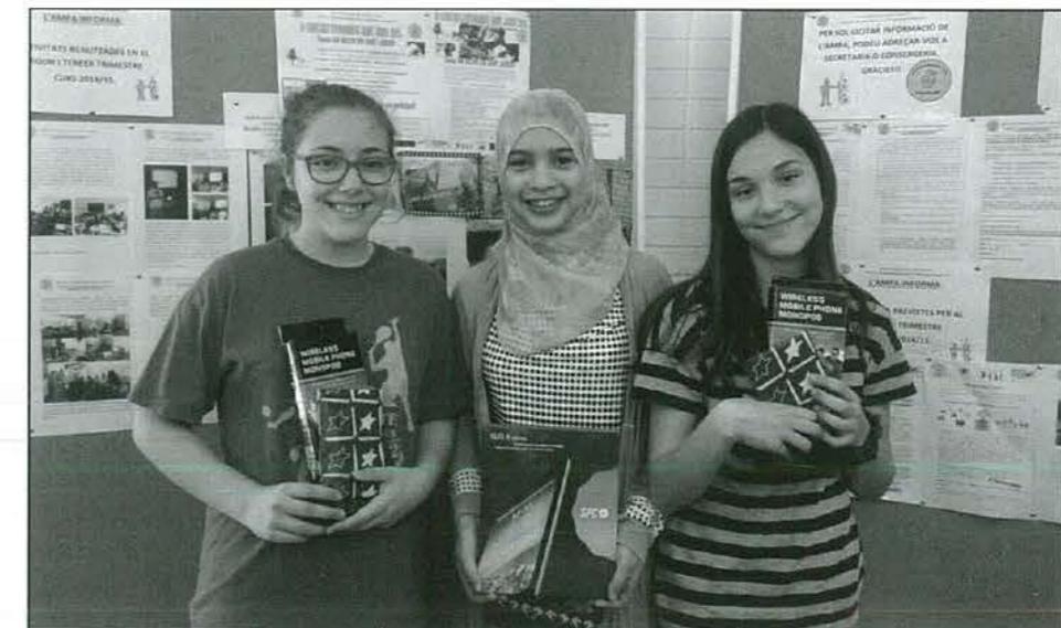
Les guanyadores després de l'entrega de premis