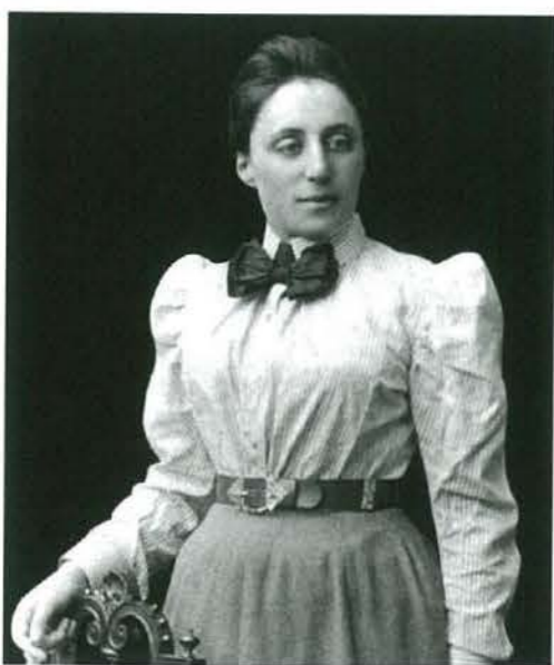
Emmy Noether (Erlangen, Alemanya, 23 de març de 1882 – Bryn Mawr, Estats Units, 14 d'abril de 1935)

En una revista anterior, ja vam parlar de Rosalind Franklin, marginada del descobriment de l'estructura de l'ADN pel fet de ser una dona. Una altra gran científica, que també va estar discriminada pel fet de ser dona va ser Emmy Noether.