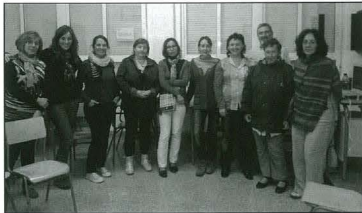
Assistents a la xerrada La Pedagogia Sistèmica com a eina d'inclusió en el món educatiu

Dins de les activitats de Nadal, la junta de l'AMPA va col·laborar una tarda al Parc de Nadal, fent un taller de ciris nadalencs. L' experiència va ser enriquidora i ens ho vam passar molt bé.