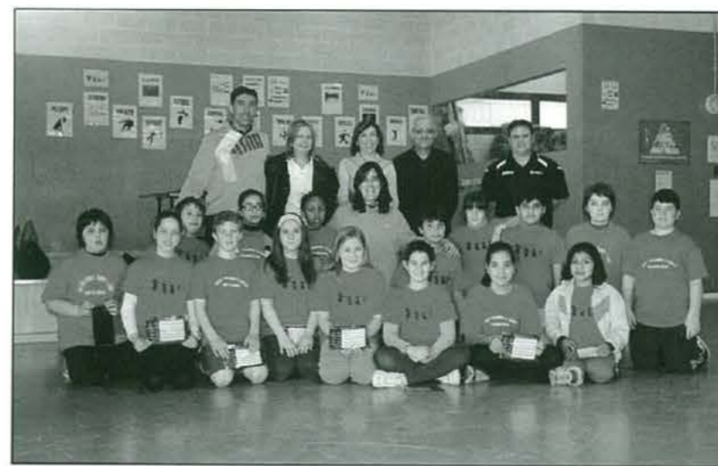
Grup d'alumnes i responsables de la càpsula formativa dels hàbits saludables

Gimnàs de l'institut. 26 de febrer de 2015