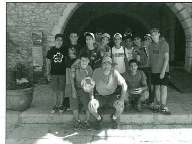
Sortida Ermita i Serra de Godall. 09 de maig de 2015