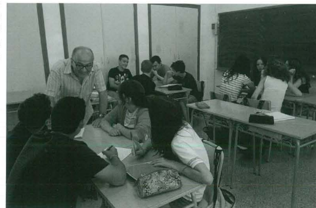
Alumnat de 2n d'ESO